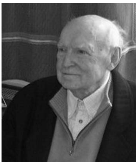
Am neunzigsten Geburtstag

Nein, nach der Freilassung zog es ihn doch in seine neue, angestammte Heimat, nach Bad Elster und so zu seiner Familie zurück. Seine Karriere begann 1949 im Sächsischen Staatsbad Bad Elster als technischer Angestellter, führte weiter als Leiter der Technischen Abteilung und endete als Technischer Direktor daselbst. Für einen Parteilosen eine enorme Laufbahn und Anerkennung. Seine Arbeit ist vielerorts anerkannt worden, von der Kammer der Technik zum Oberingenieur ernannt, vom Minister für Gesundheitswesen 1979 mit der Medaille für treue Dienste im Gesundheits- und Sozialwesen in Gold geehrt. Neben der Möglichkeit, seine Gemälde 1997 in der Wandelhalle auszustellen,